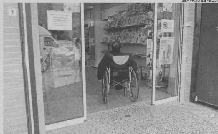
► En algunos establecimientos se facilita la movilidad.

Se realizan estudios de accesibilidad en edificios. Estos proyectos consisten en analizar las barreras físicas que pueden existir tanto en el interior como en el exterior y en los accesos. El proceso comienza analizando la existencia o no de plazas de aparcamiento para personas con movilidad