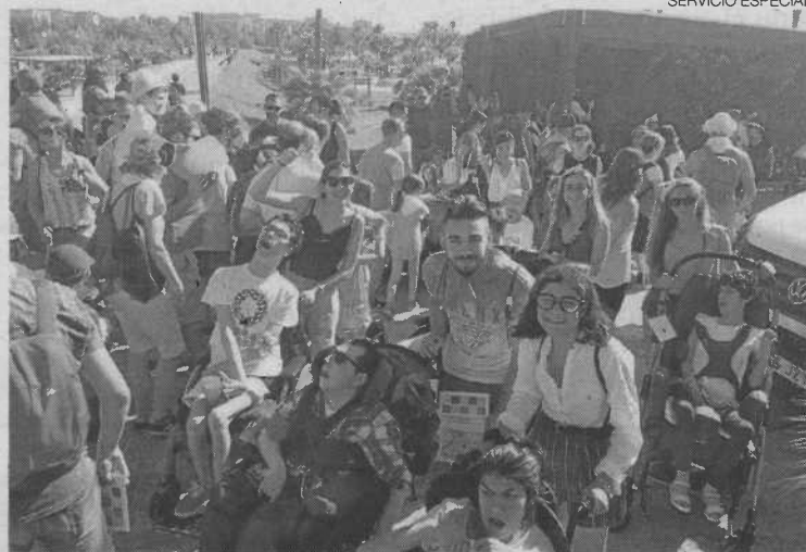
►► Voluntarios y usuarios de Araprode, en el Parque del Agua.

El objetivo de los organizadores es hacer una reflexión sobre